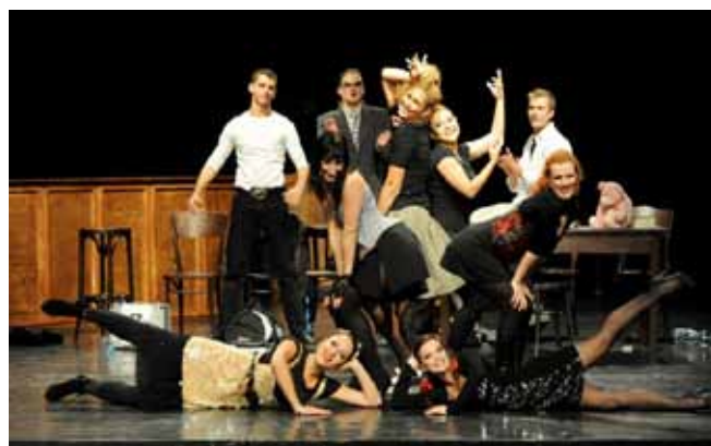
— Studenti 3. roč. muzikálového herectví v písňovém koncertu Líbej mě, líbej... , foto: Pavel Nesvadba