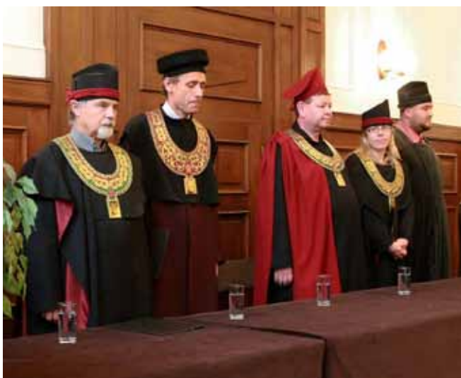
— Imatrikulace —