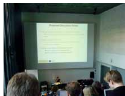
— Posluchárna s probíhající přednáškou