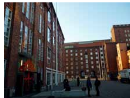
— Finská akademie umění — Kuvataideakatemia