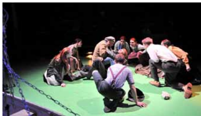
— Studenti 4. roč. činoherního herectví v inscenaci Mrzák inishmaanský