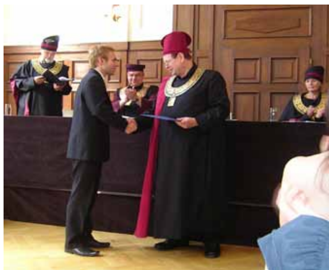
— Promoce, foto: Igor Alstern —