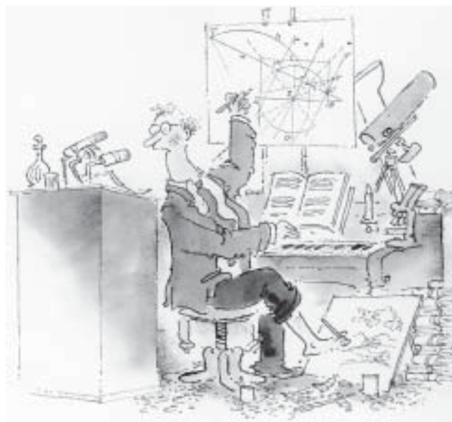
— Kresba Vladimír Renčín —

varhany v chrámu Panny Marie Sněžné z roku 1729 od králického varhanáře Johanna Gottfrieda Halbicha, přestavěné v meziválečné době a o pět desítek let později restaurované krnovskou firmou Rieger-Kloss. Už trochu prochlazení, ale přesto s velkým očekáváním jsme uzavřeli exkurzi v chrámu sv. Mořice. Tam se nachází významné, totiž v této velikosti jediné dochované varhany od slezského stavitele Michaela Englera z roku 1745 o třech manuálech a čtyřiačtyřiceti rejstřících, které však navzdory své hodnotě neušly počátkem sedmdesátých let tolik diskutované monstrózní přestavbě a totální proměně. Přibližně hodinová zkušenost s každým nástrojem samozřejmě nikomu nestačila, a tak jsme exkurzi uzavřeli myšlenkou za olomouckými varhanami se ještě v budoucnu vypravit.