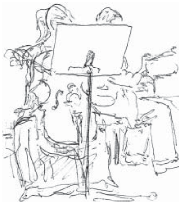
— Kresby Miroslava Hrona —